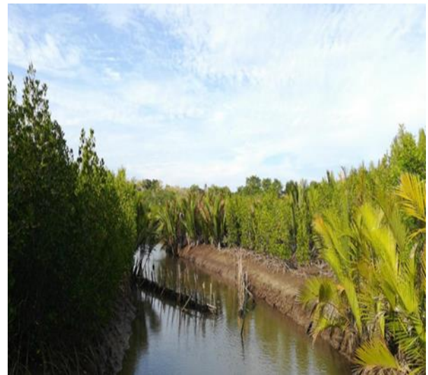
Gambar 2 Kawasan konservasi mangrove di Desa Daun (Dok Pribadi, 2022)

Langkah yang diambil sebagai usaha menjaga ekosistem di Bawean yakni kelompok nelayan se Pulau Bawean melakukan koordinasi dengan