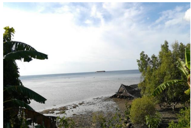
Gambar 1 Abrasi dan kenaikan permukaan air laut di sisi utara Bawean

Kondisi tersebut juga didukung oleh keadaan pulau Bawean yang mengalami perubahan dari waktu ke waktu. Berdasarkan dari hasil observasi dan wawancara dengan warga ditemukan bahwa abrasi di Bawean dimulai sejak tahun 2000. Sepanjang pesisir Bawean baik utara maupun selatan memiliki kerentanan cukup tinggi, terlihat di sepanjang pantai Tanjungori hingga Ponggoh, Kecamatan Tambak, air laut mulai melahap pasir-pasir dan mengancam daratan di wilayah tersebut. Hal tersebut juga dapat dilihat dari adanya pembeconan di sepanjang wilayah tersebut. Sementara di wilayah Daun, Kecamatan Sangkapura, ditemukan tingkat abrasi yang tinggi mengakibatkan air laut semakin mendekati daratan bahkan menenggelamkan beberapa rumah nelayan. Berdasarkan informasi dari warga tingkat kenaikan permukaan air laut diperkirakan mencapai 0,4 sampai 0,5 meter. Selain itu keberadaan banjir rob juga menjadi ancaman, karena daya rusaknya yang semakin besar.